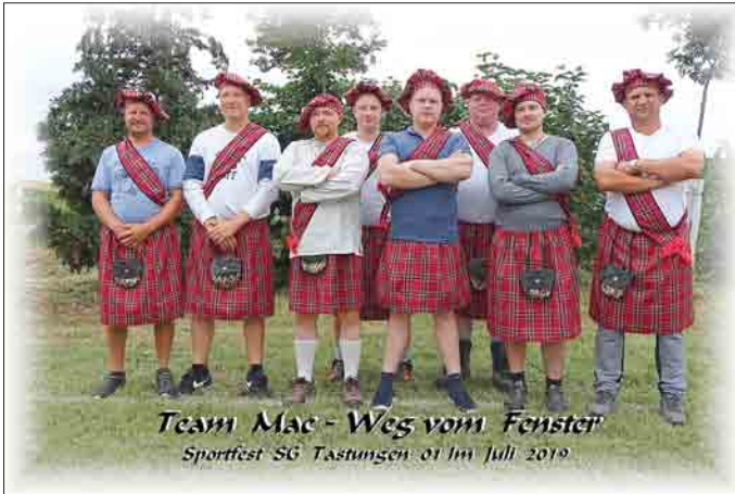
Team Mac - Weg vom Fenster Sportfest SG Tastungen 01 im Juli 2019