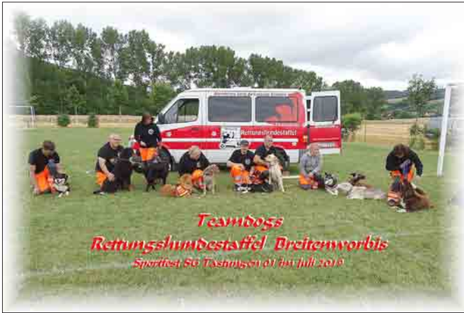
Teambogs Rettungshundestaffel Breitenworbis Sportfest SG Tastungen 01 im Juli 2019