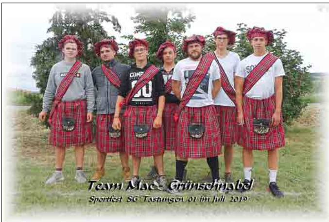
Team Mac - Grünschnabel Sportfest SG Tastungen 01 im Juli 2019