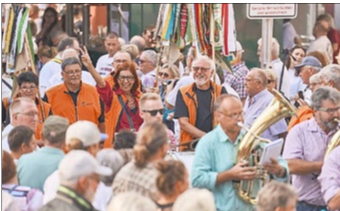
Der große Festumzug zieht am 22.09.2024 durch die Heiligenstädter Innenstadt.

Jetzt anschauen und gerne teilen: 122. Deutscher Wandertag 2024 - Das war Deutschlands größtes Wanderfest im Eichsfeld - YouTube