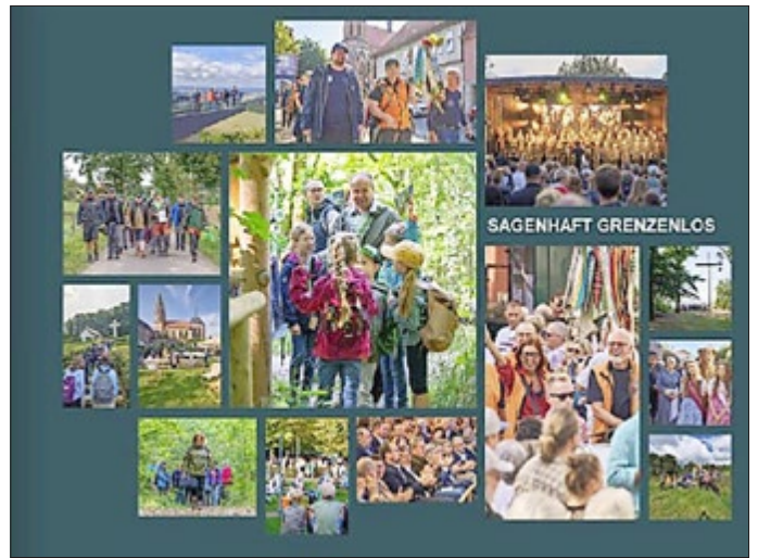
Der Bildband ist nicht käuflich erhältlich, aber kann in der Touristinfo und beim HVE angeschaut werden.