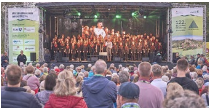
Die Eröffnung des Wandertags am 19.09.2024 auf dem Festgelände des Vitalparks.