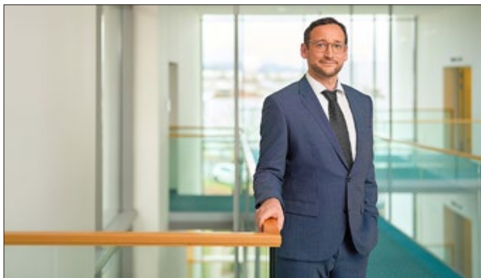
Andreas Heiroth