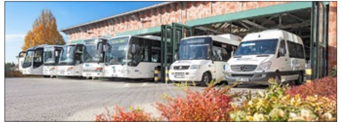
Betriebsgelände der EW Bus GmbH in Leinefelde