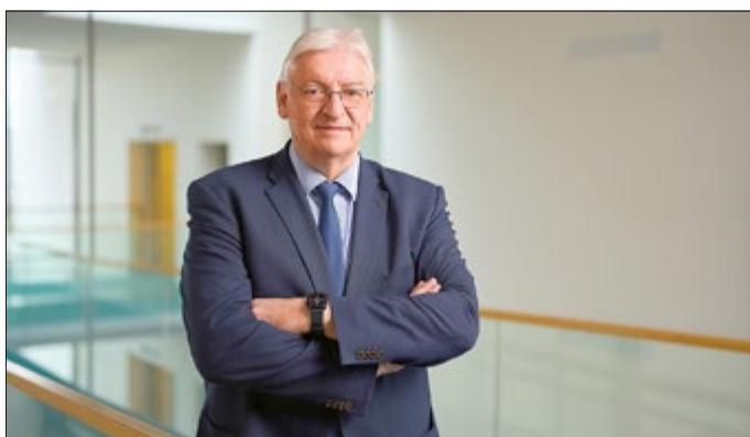
Benno Bause